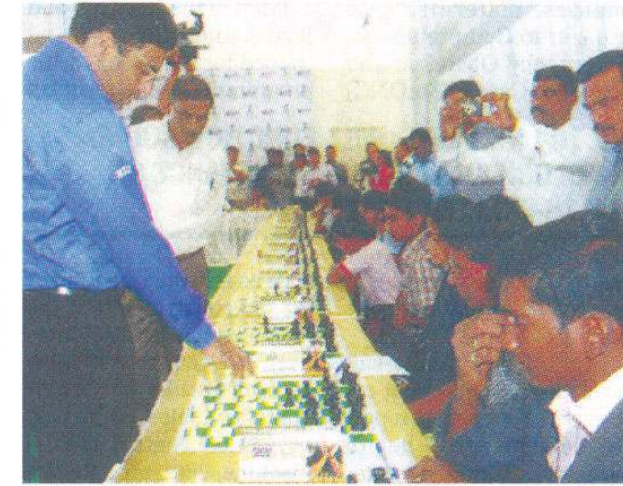
World chess champion Viswanathan Anand playing chess against 24 players at a time at SSM College, Kumarapalayam

"Chess gives students more confidence when dealing with complicated subjects. It will also improve