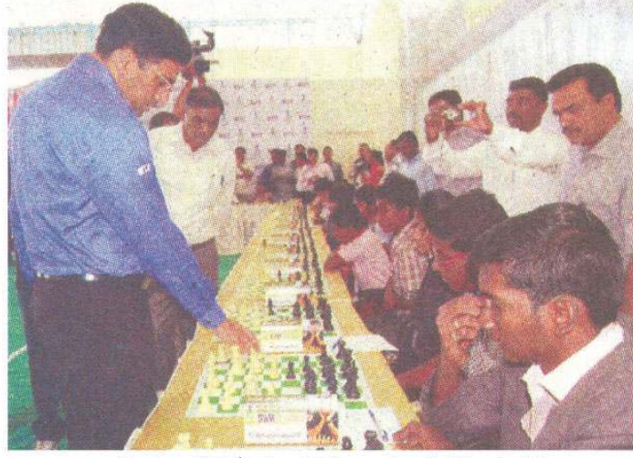
மாநில அளவில் வென்ற 24 பேருடன் ஒரே மேடையில் செஸ் விளையாடும் விஸ்வநாதன் ஆனந்த்.

வெற்றி என்பது தற்செயலாகவோ, முயற்சியில்லாமலோ கிடைப்பதில்லை. சுடின உழைப்பு, தன்னம்பிக்கை, பயிற்சி, புதுப்புது யுக்திகள், சுடந்து வந்த பாதையில் கிடைத்த அனுபவங்களைப் பயன்படுத்துவதாலும் வெற்றி கிடைக்கிறது. செஸ் விளையாட்டில் எனது