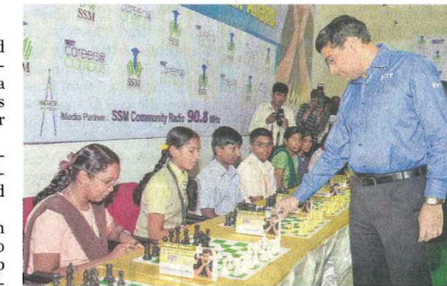
MAKING A MOVE: World Chess champion Viswanathan Anand playing chess with students who emerged winners at the state-level chess tournament organised at SSM Education Institutions at Komarapalayam in Namakkal District on Saturday.

Mr. Anand recalled his days as a school goer when chess