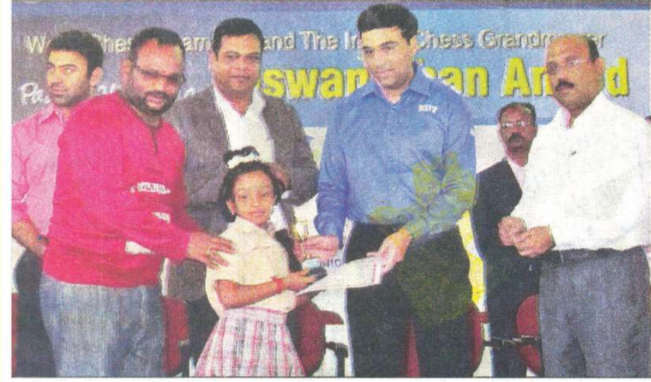
போட்டியில் வெற்றி பெற்ற மாணவிக்கு உலக செஸ் சாம்பியன் விஸ்வநாதன் ஆனந்த் பரிசு வழங்கியபோது எடுத்த படம்.