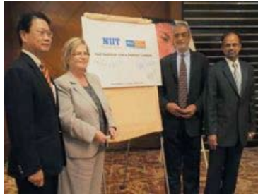
Sự "bắt tay" giữa các đại gia cung ứng và đào tạo CNTT được kỳ vọng sẽ góp phần giải quyết bài toán thiếu hụt nhân lực CNTT cấp cao tại VN.

Một khảo sát trên 12 quốc gia tại khu vực châu Á - Thái Bình Dương của IDG cho thấy, đến năm 2009, khu vực này sẽ thiếu hụt khoảng 221.000 chuyên gia công nghệ mạng. Theo đó, các chuyên gia công nghệ mạng và bảo mật mạng với các kỹ năng về công nghệ tiên tiến như công nghệ không dây, bảo mật và thoại IP sẽ rất "có giá". Riêng các quốc gia đang phát triển và có tốc độ phát triển CNTT nhanh chóng như Việt Nam, sự thiếu hụt nói trên lại càng nghiêm trọng hơn.