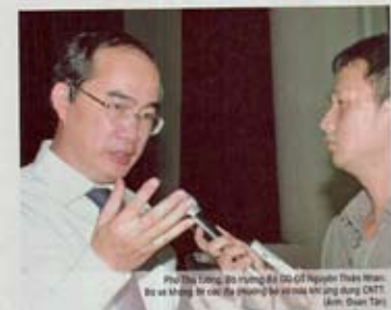
Phó Thủ Tướng Nguyễn Thiện Nhân. Ông đang nói chuyện với các sinh viên đang CNTT.